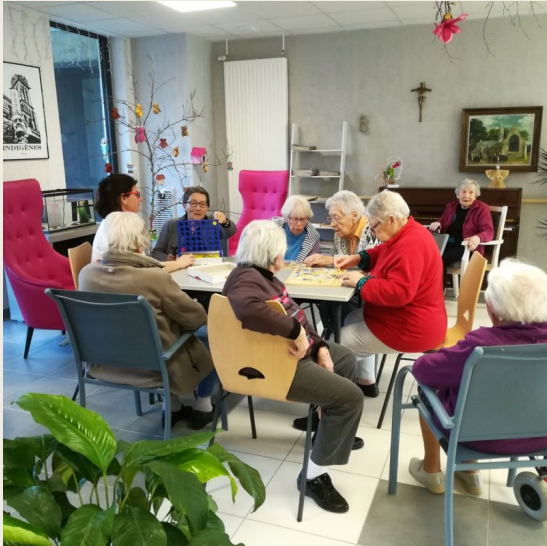
La maison de retraite de sa maman où elle aimait aller.