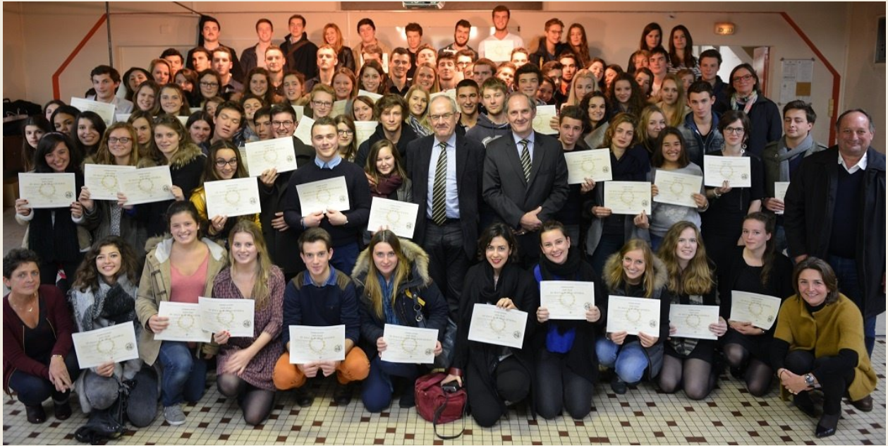
Jour du bac de son fils