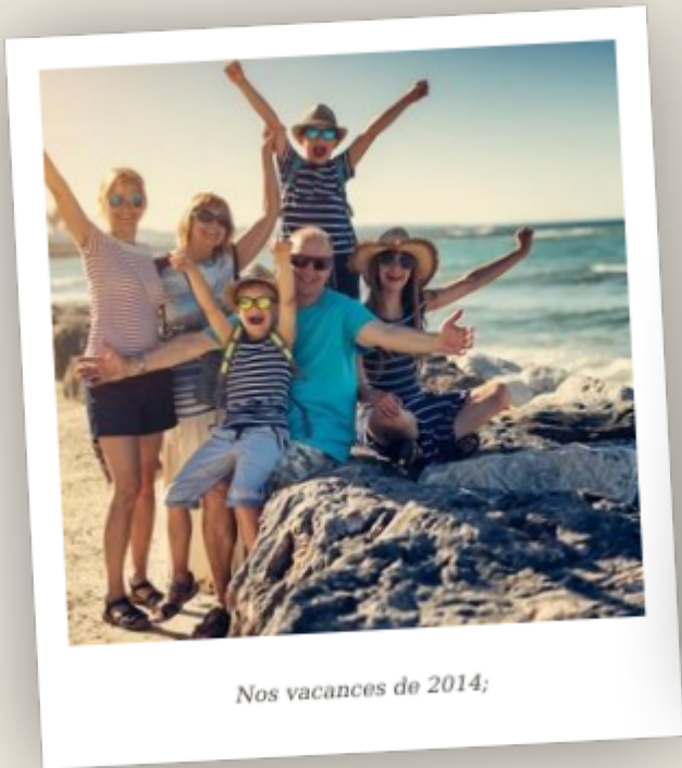
Nos vacances de 2014;