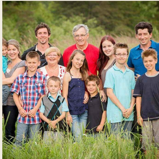
Souvenir de vacances en famille.