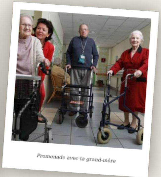
Promenade avec ta grand-mère