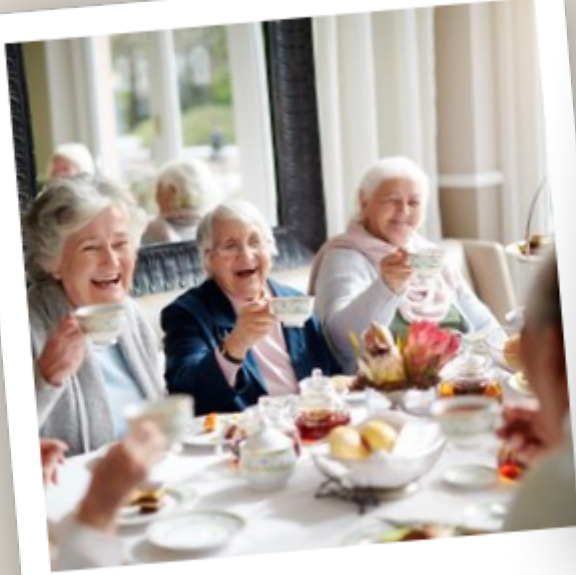
Mémé avec ses amies