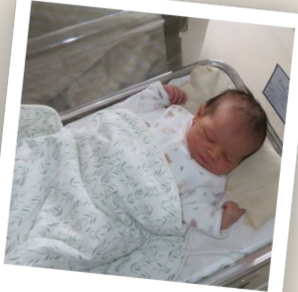
Ton bébé à sa naissance.