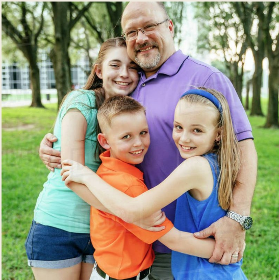
Son fils et ses petits-enfants.